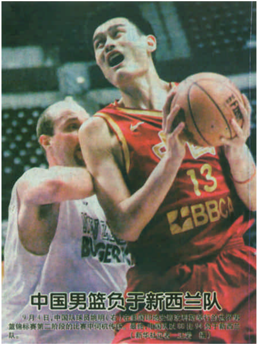
中国男篮负于新西兰队 9月4日,中国球员姚明(右)在悉尼亚运会男篮决赛中不敌新西兰队,中国队以66比74负于新西兰队。

新华社汉城9月4日体育专电 亚运会还有不到一个月的时间就要开幕了,扬言要保住金牌总数第二的韩国队目前正在紧张的训练,但一场突如其来的红眼病在韩国国内肆虐,也让不少队员受到了感染。