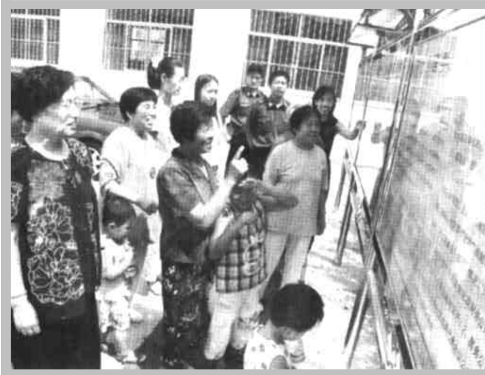
东营区胜安社区居委会积极推行居务公开制度，凡涉及居民切身利益的事项，都定期公开张榜，让居民做到心中有数，受到广大居民的欢迎。