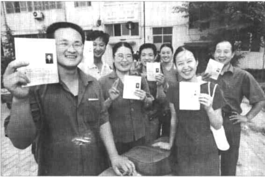
9月4日,济南市长清区7位农民领到县级机关公务员准考证。

今年3月和6月,欧盟和日本先后核准了《京都议定书》。但由于世界温室气体头号排放“大户”、排放量为1990年全球排放总量36%以上的美国去年突然宣布退出,目前核准《京都议定书》的发达国家,温室气体排放量仅为1990年全球温室气体排放总量的37.1%,尚未达到使这一议定书生效的要求。