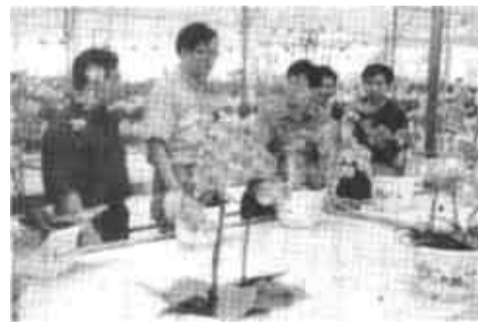
广饶县农村信用社大力实施“文明信用工程”,推动“信用东营”的建设,加大了对“文明信用企业”的支持力度,目前该社已为“文明信用企业”累放贷款2.2亿元。图为联社领导到“文明信用企业”进行市场调查。(徐庆三)

利津讯 利津县汀罗镇悄然兴起一股“补拍婚纱照”热。老人们风趣地说:“如今生活富裕了,也让我们风光风光,找找新婚的感觉。”近年来,随着人们生活水平的提高和生活观念的转变,利津县汀罗镇许多老夫妻到照相馆扮上彩妆、穿上新郎、新娘装补拍“婚纱照”。有的老夫妻还在结婚纪念日宴请亲朋或者选择外出旅游,重度“蜜月”。补婚成了一桩新鲜事,也成了中老年夫妻的一桩乐事。日前,该镇已有50对老年夫妻参加到了“补婚”行列。(薄纯民)