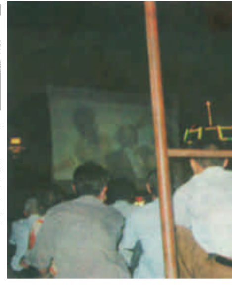
露天电影广场放 每当夜幕降临的时候,伴随着凉爽的晚风,在胜利广场休闲的人们就会发现,久违了的露天电影出现在人们的视野里。或立或蹲,正面反面,电影的内容并不重要,重要的是都市里关于露天电影的怀旧。露天电影,真好!

垦利县 垦利县垦利镇围城村农民发挥地处城区,交通便利的区位优势,采取以地招商、借梯上楼的办法,围绕城区改造建设,大力实施房地产开发,成为县城换颜改貌投资的一支生力军。目前,全镇13个围城村共开发商品房4万多平方米,累计投入资金2800多万元。 这个镇地处县城驻地,在实施城镇建设中,一是借县城拆迁改造之际引导群众融资搞开发。由群众个人融资1500多万元,先后对胜利路、大桥路两侧进行了拆迁改造。今年共开工建设面积21000平方米,已竣工并投入使用。